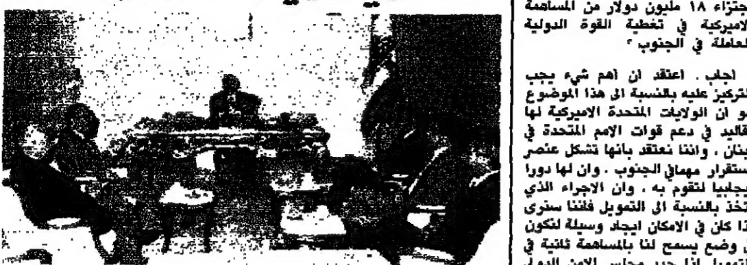
كرامي مع وفد جهة الاتحاد الوطني. ■ (اسماعيل حداد)

واصل امس وفد جهة الاتحاد الوطني، تحرك مع القيادات الرسمية والفاعليات، طارحا فكرة انشاء جهة سياسية جديدة، لمواجهة كل التطورات الامنية والسيسية والوقوف صفا واحدا لتحقيق الاهداف التي تسعى اليها الجهة. فقبل ظهر امس زار وفد من الجهة ضم السادة الدكتور مروان فارس، هادي جمعة، كريم مروان، عبد الامر عيسى وكرم شبيب رئيس الحكومة السيد رشيد كرامي في مكتبه بالقرى الحكومي، وعرض معه التطورات الاخيرة في ضوء تنفيذ الخطة الامنية لبيروت الغربية، اضافة الى المستجدات السيسية وخصوصا ما يتعلق منها بالافكار المطروحة لاستئناف اجتماعات الائتلاف الثلاثي في دمشق. بعد ذلك، زار الوفد رئيس مجلس النواب السيد حسين الحسيني، وطرح عليه الافكار المتداولة بين اعضاء جهة